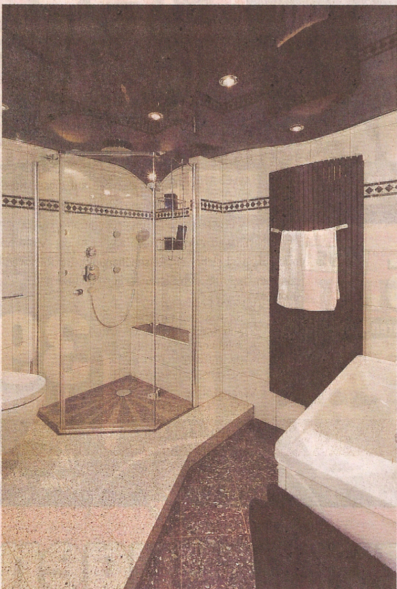
Ein Beispiel von tollen Bädern.

Das ist aber längst nicht alles. Ein verbindlicher Baubeginn sowie eine verbindlich festgelegte Bauzeit zählen mit zu den Pluspunkten. Uwe Brimberg: „Unser Ziel ist es, jedem Kunden sein individuelles Bad mit unserem Team innerhalb kürzester Zeit zum Festpreis einzurichten oder zu sanieren.“